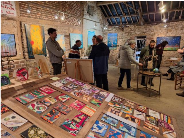
Et voici deux photos de l'expo même.