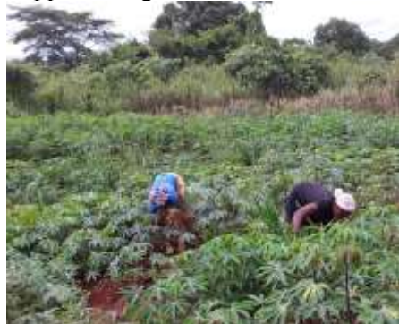
A Nkambe, la Communauté religieuse

pour jeunes filles. Sr Colette est certaine que sa présence pourra de nouveau motiver les jeunes filles et filles-mères à se donner à l'apprentissage de la couture.