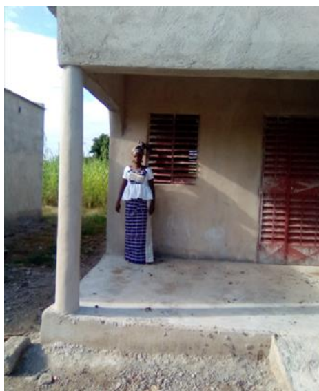
L’institutrice devant l’habitation