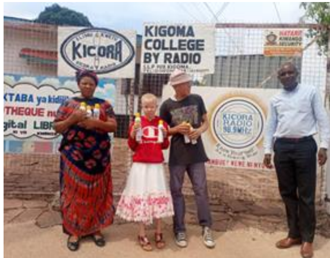
Jeune fille "albinos" tenant des flacons de "lait de peau"

- Pour les journalistes sur terrain, la radio a pu acheter une seconde moto notamment grâce aux dons de 370 élèves de l'Institut Libre du Condroz Saint-François, à Ouffet, et au goûter organisé par l'établissement.