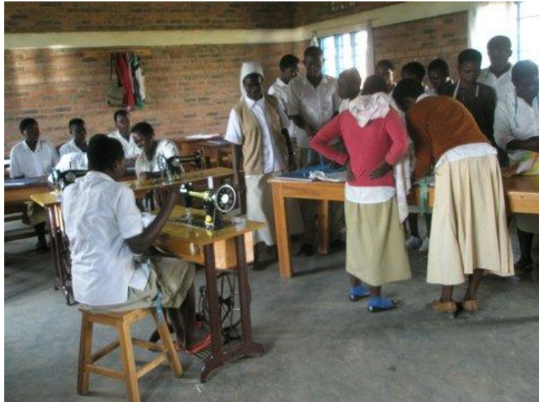
Cours de couture à Masaka

Toutes ces réalisations, dues au dévouement des Sœurs Dominicaines Missionnaires, méritent d'être soutenues financièrement car sans argent, rien n'est possible. N'hésitons donc pas à aider les DMA dans la mesure de nos moyens et avec générosité.