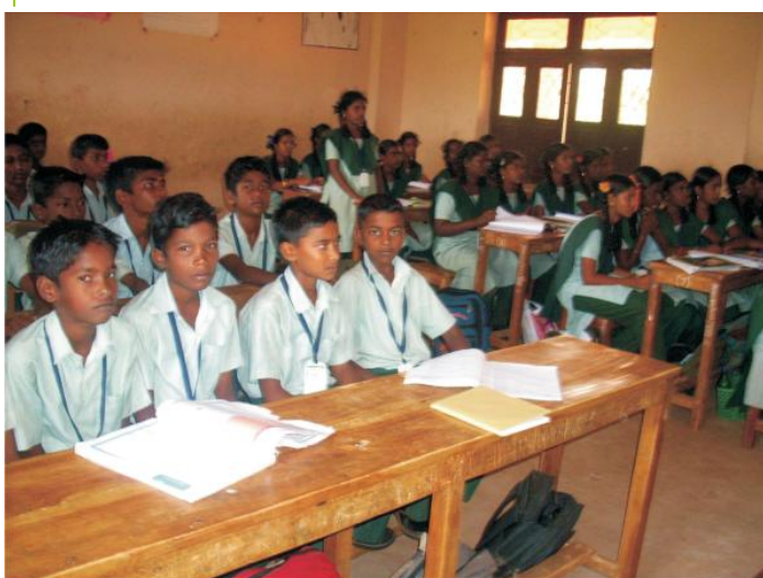
Elèves de l'école de Poncos