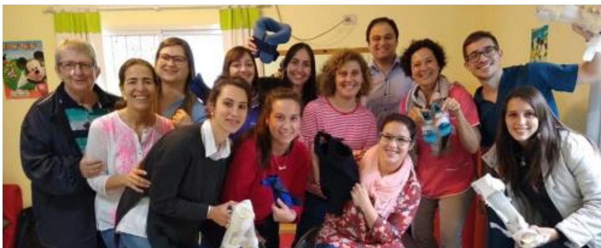
L'équipe du Centre "Los Pequeños Pasos"