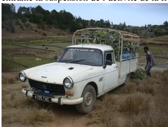
Les champs de la ferme et la récolte