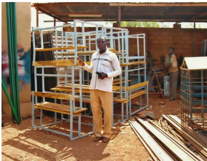
Le menuisier avec les premières tables-bancs

« Voici la troisième année que vous soutenez le projet de remplacement et d'acquisition de tables-bancs pour l'école de Bozo, au Burkina Faso. Dans le cadre de leurs activités en faveur du développement de Bozo et des cinq autres villages qui relèvent de lui, les fils du village s'étaient engagés à faire une opération « tables-bancs » pour améliorer les conditions d'études et de travail de leurs frères et enfants. Comme cela a été dit dans les demandes antérieures, les tables-bancs datent de 1977, date de la construction de l'école de Bozo, école pilote qui engendrera d'autres écoles dans les 5 autres villages. Le nombre de tables-bancs est devenu très insuffisant non seulement par la détérioration de tables-bancs de 1977 mais aussi par le nombre d'enfants inscrits à l'école sans cesse croissant. Un des signes positifs de cette situation est que Bozo non seulement est érigé en centre d'examen mais aussi en Collège d'Enseignement Général ; et une autre école primaire qui a déjà commencé sous une paillote est en construction.