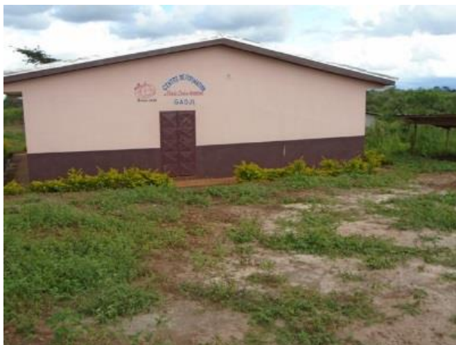
Le nouveau Centre de formation à clôturer

En effet, comme vous le saviez déjà, notre Centre de Formation a ouvert ses portes en octobre 2015 avec une cinquantaine d'élèves (femmes mariées, filles mères et quelques garçons et deux hommes mariés). Nous étions agréablement surpris car nous ne nous attendions pas à un grand groupe.